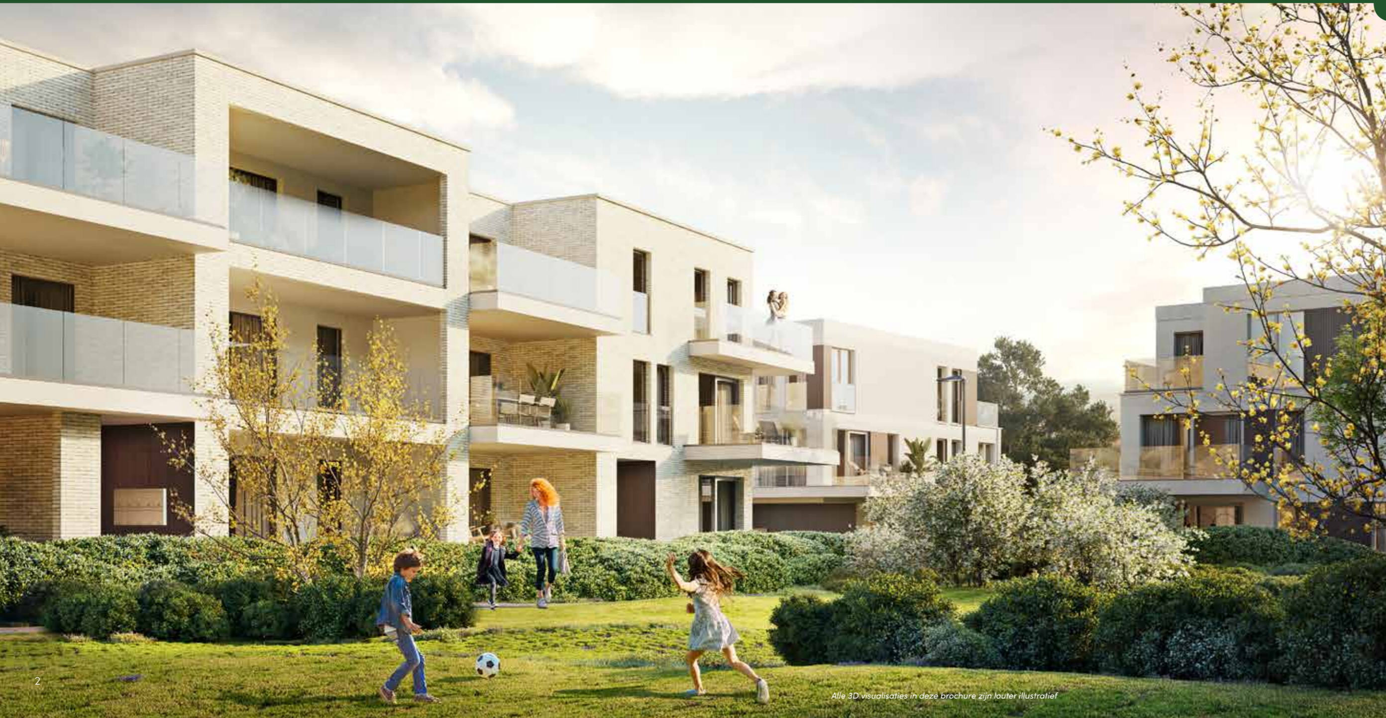
Alle 3D visualisaties in deze brochure zijn louter illustratief